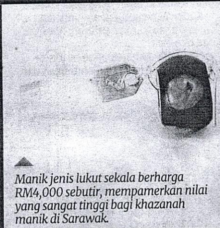
Manik jenis lukut sekala berharga RM4,000 sebutir, mempamerkan nilai yang sangat tinggi bagi khazanah manik di Sarawak.

"Malah, dalam acara ritual tertentu manik dipercayai mempunyai kuasa menyembuhkan penyakit, menjadi